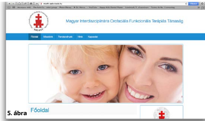
5. ábra Főoldal

sed medicine alap üzenetének megfelelő szakmai standardokat állítson fel, de sajnos nincs válasz a mellékhatásokra és a kezelésvégi recidivára sem. Ennek feltételezett oka, hogy az orofaciális régió a komplex emberi szervezet elválaszthatatlan része, és igazán stabil, valamint mellékhatásmentes eredmény csak akkor érhető el, ha a fogszabályozó kezelés figyelembe veszi ezeket az összefüggéseket is. Ilyen módon van szükség az új, ún. modern funkcionális fogszabályozási paradigma bevezetésére.